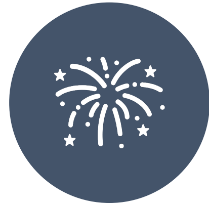
KAHOOT IN CHALLENGE