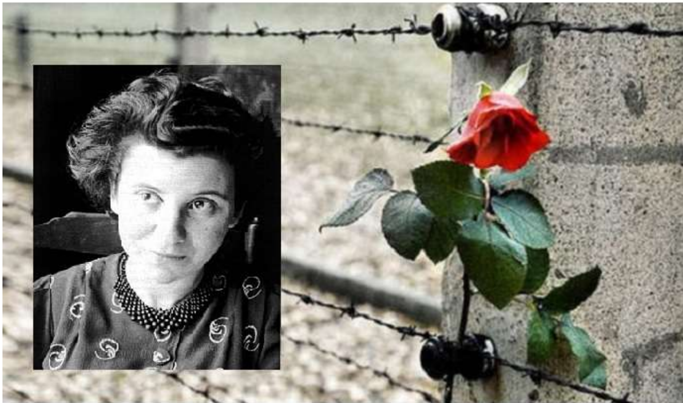
Etty Hillesum 1914 – 1943