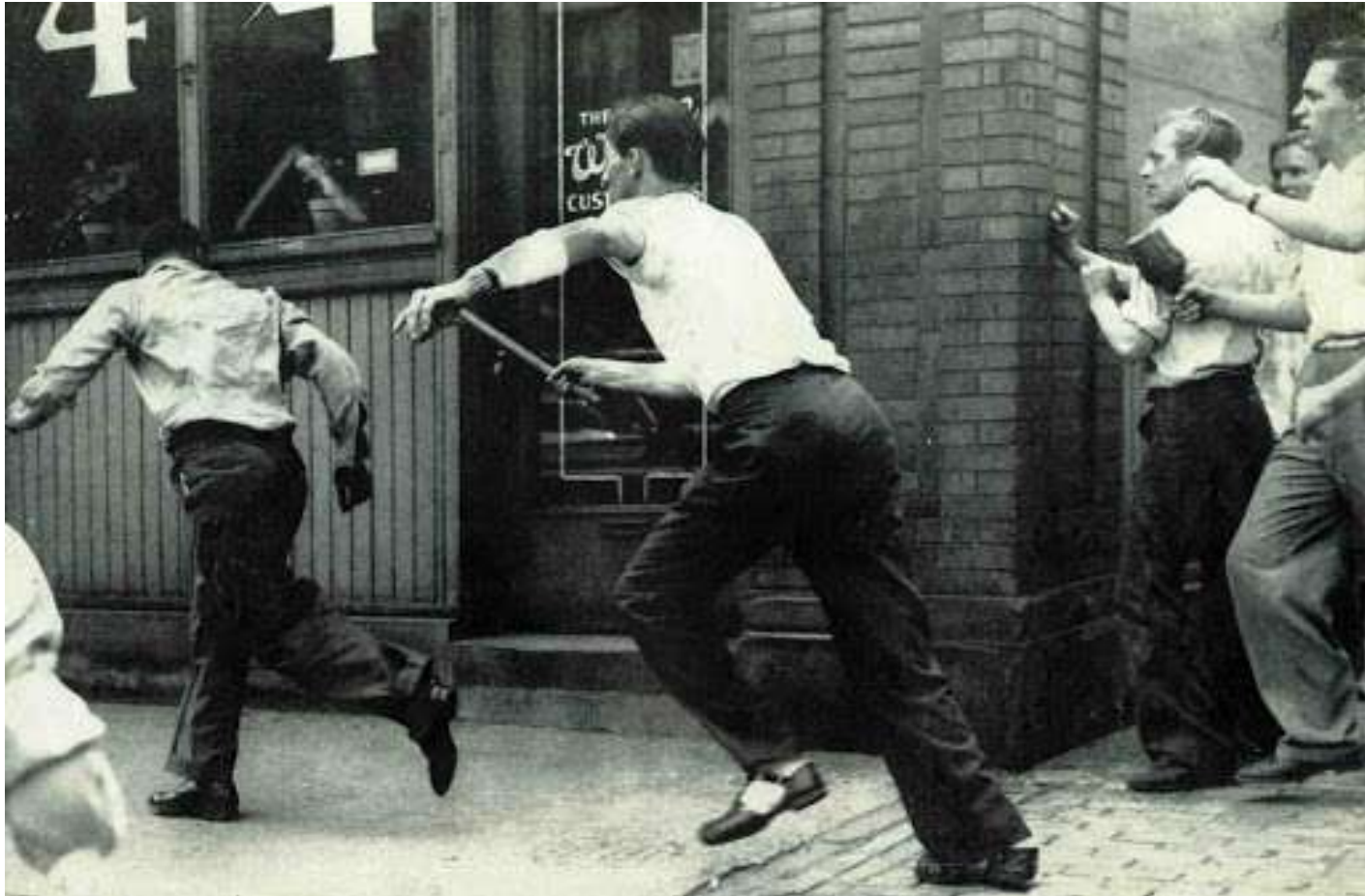
Tumulti razziali Detroit 1943