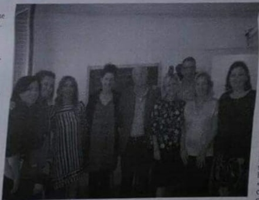
IL SINDACO CON I DOCENTI

Le classi prime della scuola primaria della scuola secondaria di grado di Sant’Andrea saranno